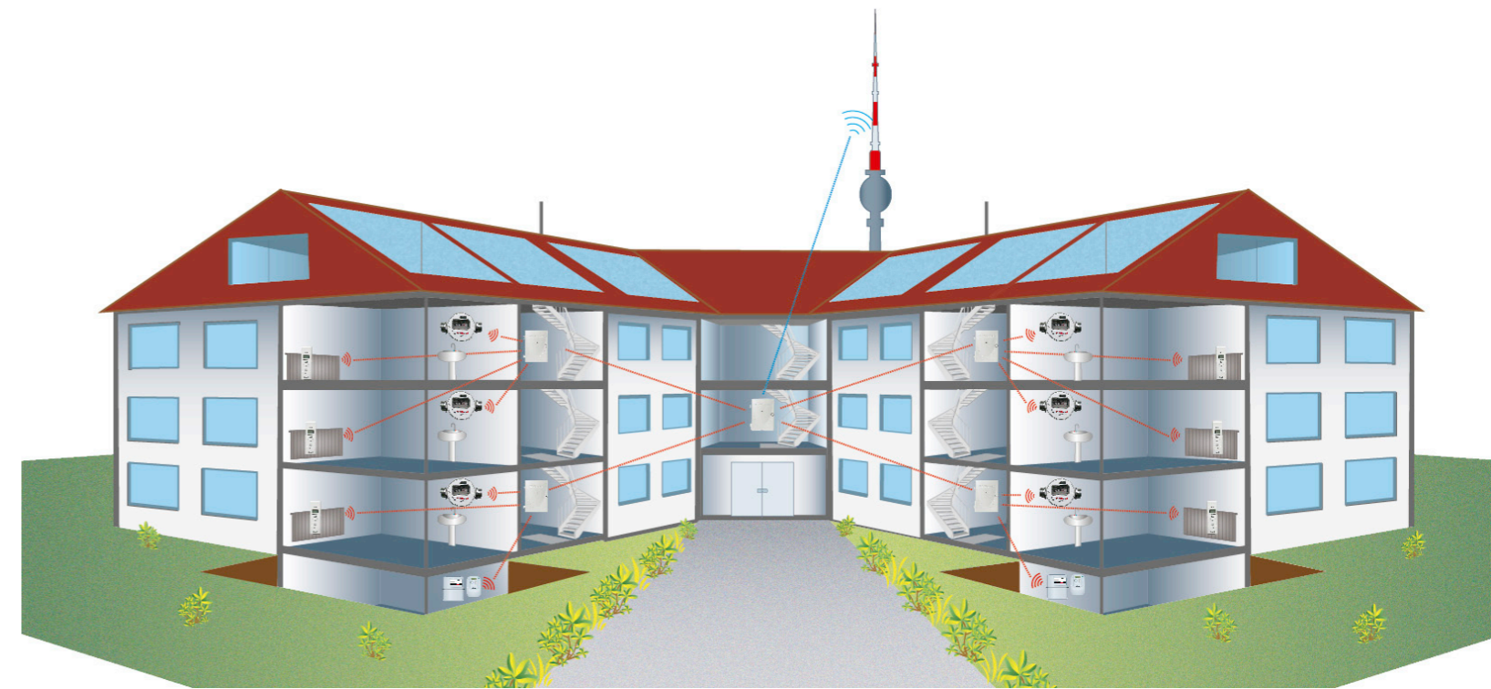
Minol Funksystem radio 3 in seiner Ausprägung als Datensammler-Netzwerk

In Verbindung mit dem Energiemonitoring können Wohnungsverwalter das gesamte Potenzial des Funksystems nutzen. Energiemonitoring steht für die laufende Analyse der erfassten Verbrauchswerte mit dem Ziel, die Betriebskosten zu optimieren. Minol hat dazu den Online-Service „eMonitoring“ entwickelt. Er ermöglicht Wohnungsverwaltern, den Energieverbrauch und die Betriebskosten ihrer Liegenschaften nahezu in Echtzeit zu verfolgen und auf die Entwicklung zeitnah zu reagieren.